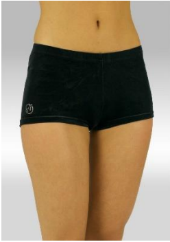
Turnbroekje meisjes: zwart